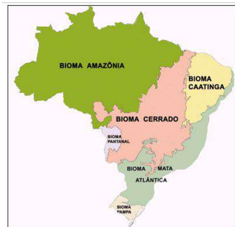
Figura 3. Mapa de Biomas do Brasil (IBGE, 2004).

No entanto, a área geográfica delimitada da Indicação de Procedência do “Mel do Pantanal” nos estados do Mato Grosso do Sul e Mato Grosso será baseada no Mapa de Biomas do Brasil (Figura 3) do Instituto Brasileiro de Geografia e Estatística - IBGE (2004), segundo o qual a área do Pantanal é de 150.355 km 2 .